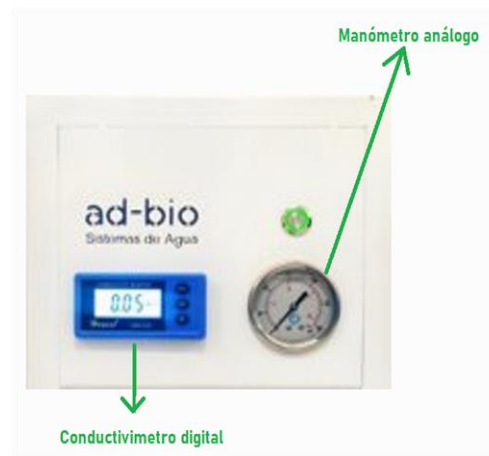
Figura 2. Medidor digital y análogo