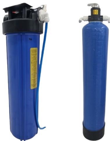
Figura 3. Adicionales a contemplar