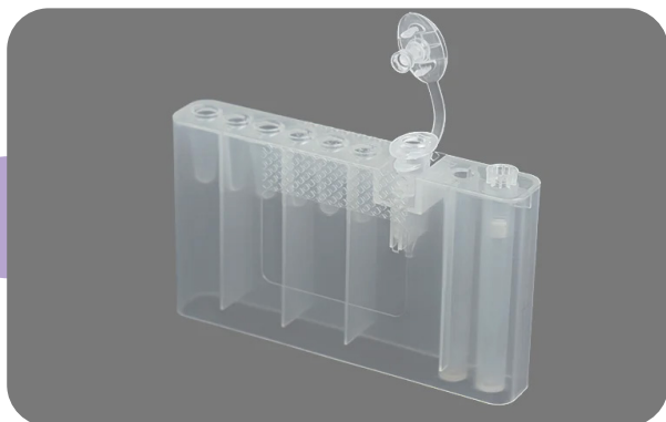
Cartucho de procesamiento